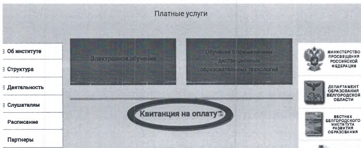
Рис. 3 Квитанция на оплату

2. Оплатить организационный взнос за участие в межрегиональном заочном Конкурсе видеороликов для учителей физической культуры, музыки, изобразительного искусства, мировой художественной культуры, педагогов-организаторов основ безопасности и жизнедеятельности, используя услуги банка, онлайн версии услуг банка или мобильный телефон, указав следующую информацию: